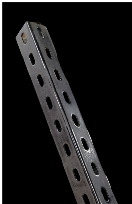
Kątownik perforowany ocynkowany 55x40x2mm