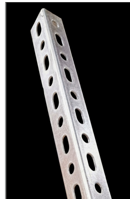
Kątownik perforowany ocynkowany 30x30x2mm